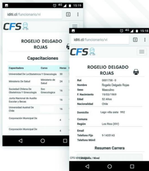
100% COMPATIBLE CON TELÉFONO MOVIL

El panel de control permite filtrar el listado de funcionarios por nivel, categoría y permite la búsqueda rápida de funcionarios por nombre,